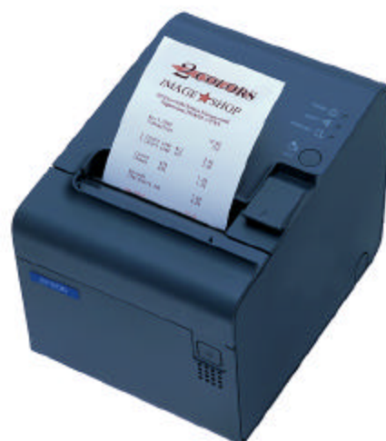
Auch in „Dark grey“ für jeden POS geeignet