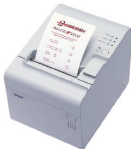
Der schnellste Thermodrucker, wahlweise mit zweifarbigem Druck: EPSON TM-T90

Mit seiner enormen Druckleistung von 70 Millionen Zeilen (einfarbiger Druck, MCBF) und seinem Stand-by Energiesparmodus steht der TM-T90 außerdem für überaus hohe Zuverlässigkeit bei gleichzeitig niedrigen Unterhaltskosten.