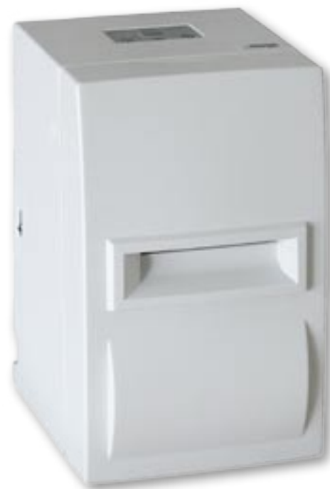
Star SP500 in der platzsparenden senkrechten Aufstellung. Kompakte Stellfläche von nur 163 x 140 mm!