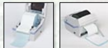
Peller und ext. Etikettenzufuhr standardmäßig.