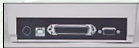
v.r. RS232, parallel & USB-Schnittstelle standardmäßig, ganz links: Stromversorgung (ext. Netzteil)