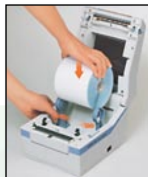
einfacher und schneller Etikettenrollenwechsel