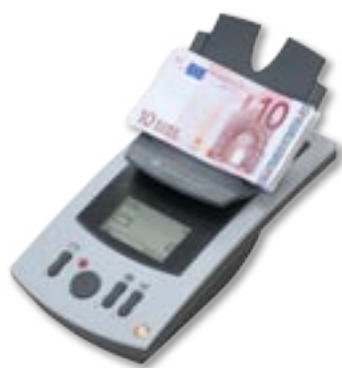
Tellermate TD + beim Zählen von Scheinen.

Mit über 250.000 elektronischen Geldzählgeräten im Einsatz ist Tellermate der weltweit führende Anbieter.