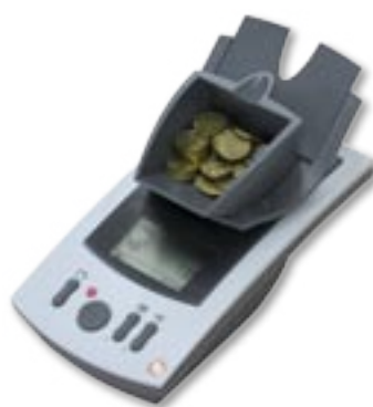
Tellermate TD + beim Zählen von Münzen (im Cup).