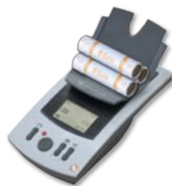
Tellermate TD + beim Zählen von Münzrollen.